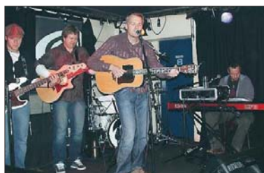
THE TROUBADOUR I LONDON Mange kjente navn har stått på denne scenen, som Bob Dylan, Joni Mitchell, Jimi Hendrix og sist helg, sarpingene i Bristol Songs.